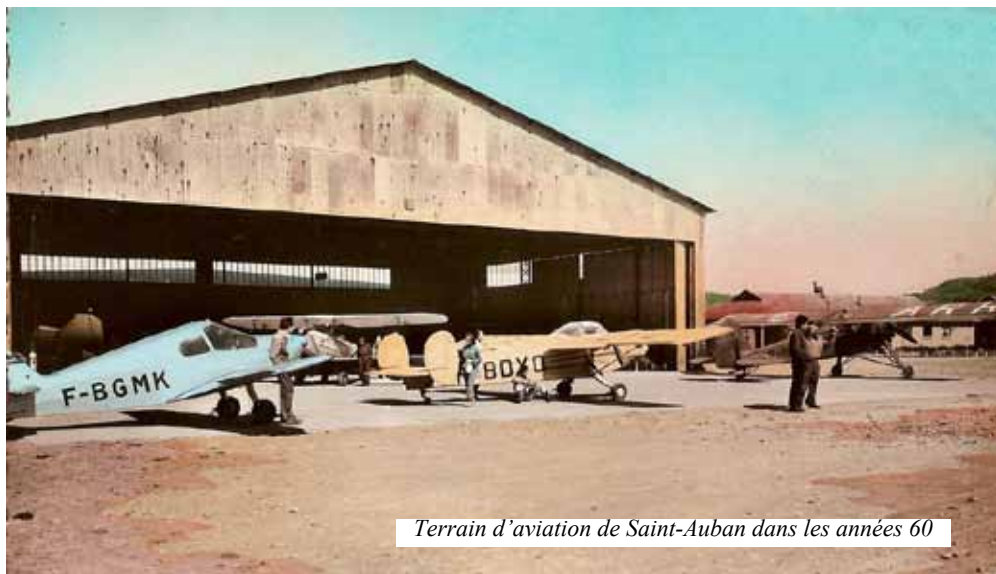
Terrain d'aviation de Saint-Auban dans les années 60

L'histoire du vol à voile se confond avec celle de l'aviation car les premières tentatives pour voler ont été réalisées avec des planeurs. Les frères Voisin et Wright furent parmi les premiers aventuriers.