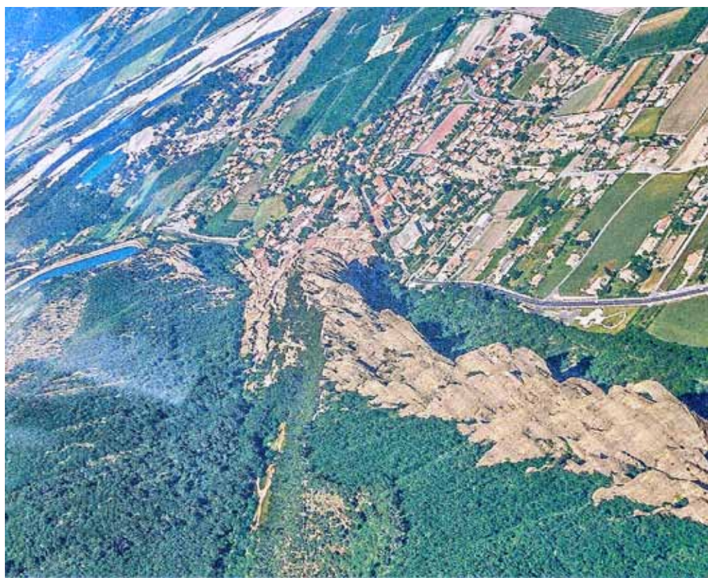
Les Mées vues d'un cockpit d'avion