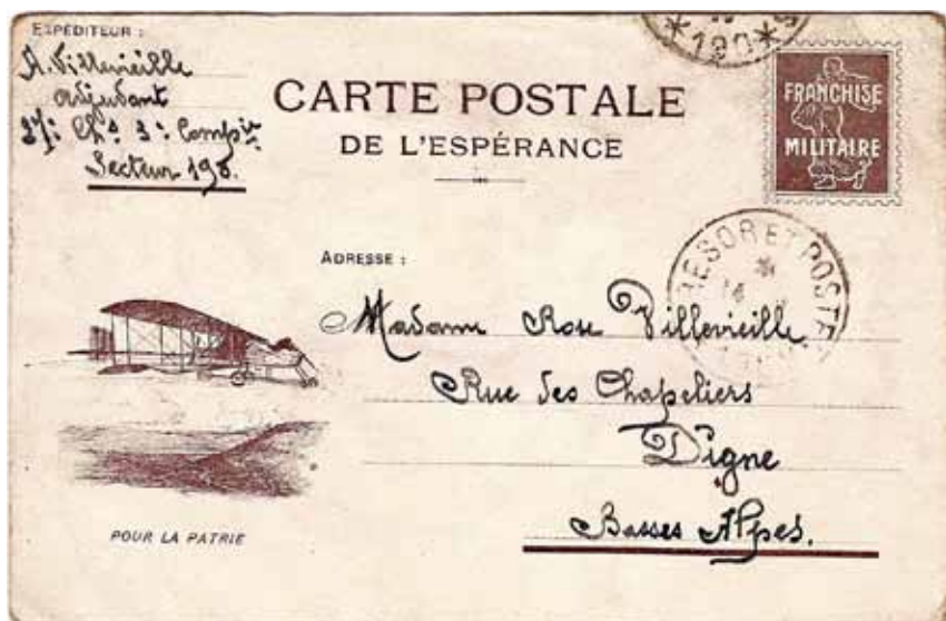
Carte postale avec franchise militaire