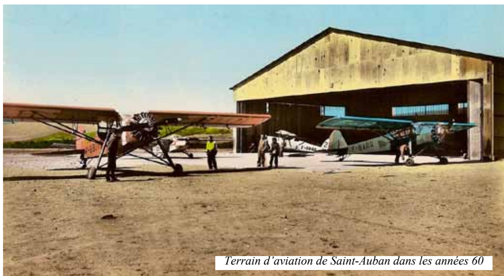
Terrain d'aviation de Saint-Auban dans les années 60

Si le terrain de vol à voile de Château-Arnoux-Saint-Auban n'est pas le premier, c'est un des tous premiers (1934) et c'est probablement le plus ancien encore en activité. Tous les amateurs européens de cette discipline le connaissent.